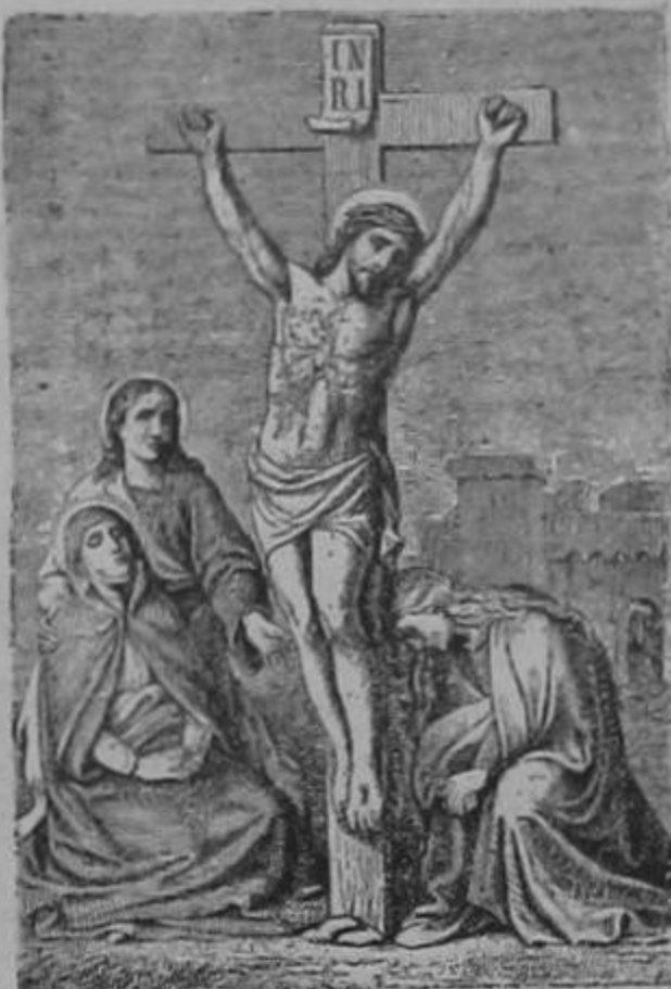
A. Salazar Herrera

Poco hacía que, en un arranque de no igualado amor para la pobre humanidad, había realizado el portento de los portentos: milagro que seguiría repitiéndose a través de todos los tiempos, maravilla ante la que sentirían el alivio santo miradas de gentes de todas las razas, de todas las naciones... y ahora, tan pronto, vedle tan herido, abandonado hasta de aquellos a quienes tanto enseñó y amó, para ir al siguiente día a dar la última y enorme prueba de su amor para los hombres, al morir en el árbol de la Cruz.