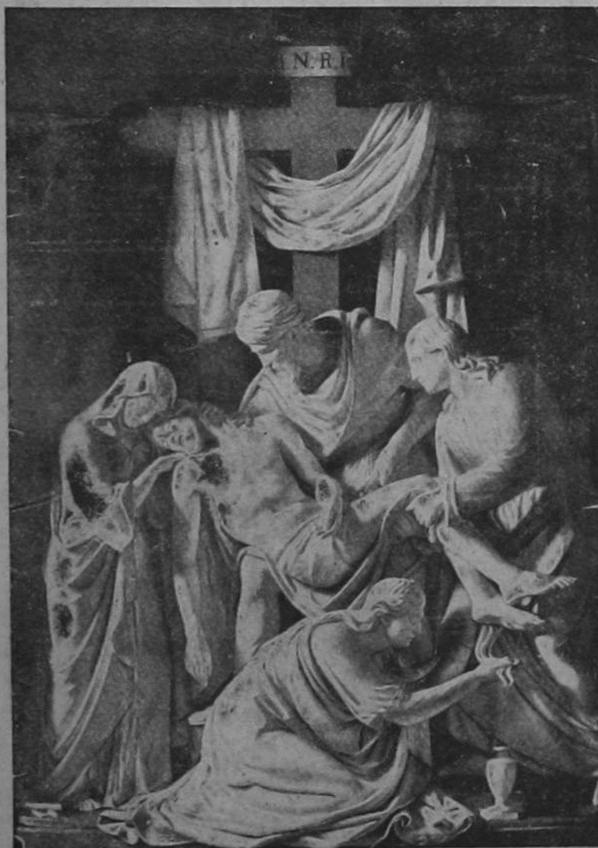
«Te adoramos Cristo y te bendecimos porque con tu Santa Cruz redimiste al mundo».